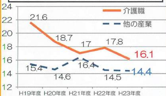
介護職と産業計の離職率の推移 (単位：%)